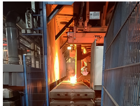
HWS-Formanlage: 1100x900x300/300 + 50 DISA-Formanlage: 600x480xvariable Tiefe

Unsere Formanlagen ermöglichen eine präzise und effiziente Fertigung von Gussteilen. Mit einer horizontalen Formanlage und einer vertikalen Formanlage sind wir in der Lage, auch komplexe Bauteile in großen Stückzahlen herzustellen. Mit unseren Anlagen ist es uns möglich die Wunschgrößen und -gewichte unserer Kunden zu gewährleisten. Automatisierte Prozesse sorgen für eine hohe Reproduzierbarkeit und Qualitätssicherheit.